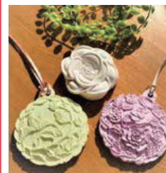
ものづくりサークル

大学などの研究機関や国のプロジェクトでの効果立証のある「認知機能低下予防プログラム」を道南地区で唯一導入しているデイサービスです!笑顔やコミュニケーションが生まれ、楽しく有意義な時間を過ごすことができます。その他、絵手紙や小物作りなどのサークル活動も人気です。