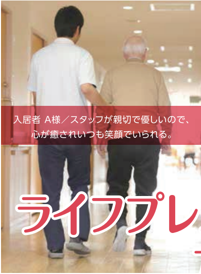
入居者 A様 / スタッフが親切で優しいので、心が癒されいつも笑顔でいられる。