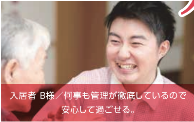
入居者 B様 / 何事も管理が徹底しているので安心して過ごせる。