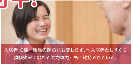
入居者 C様 / 職員の顔ぶれも変わらず、他入居者ともすぐに顔馴染みになって気力体力ともに維持できている。